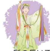
髪の長い巫女さんの象形